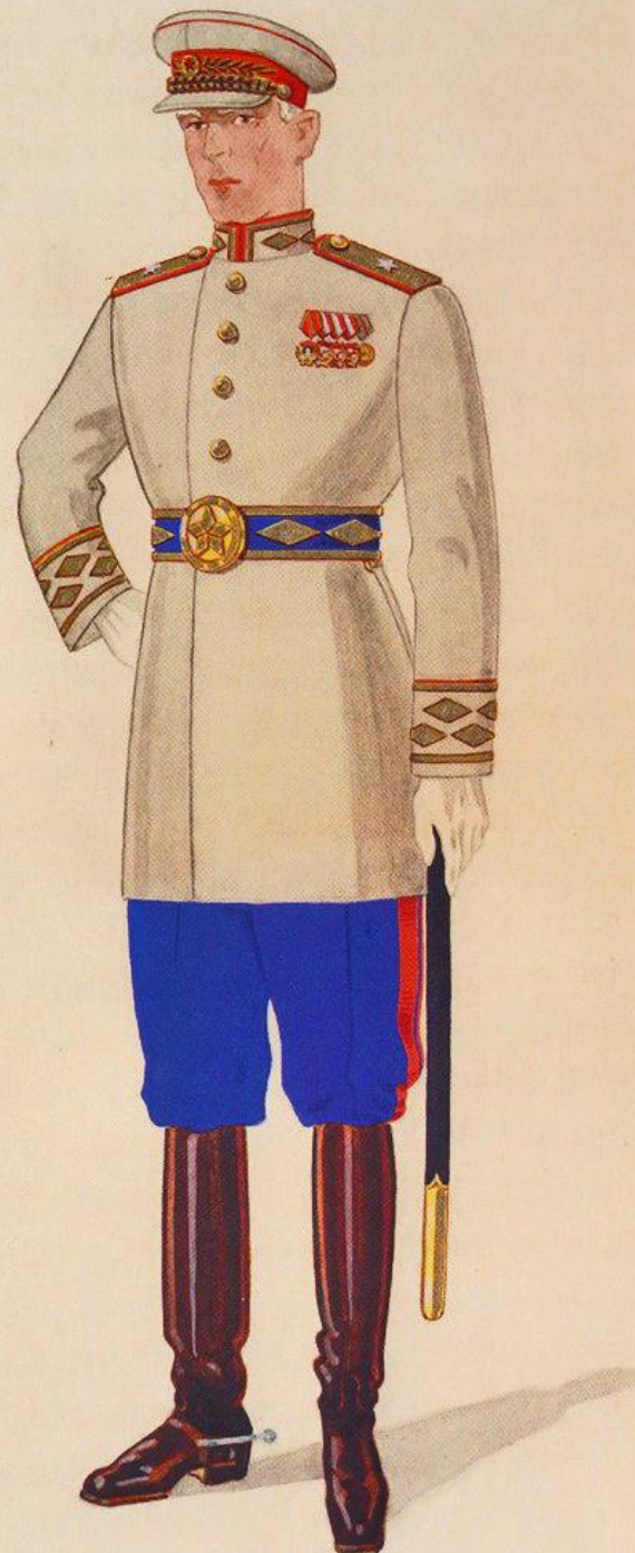
Армия Латвийской ССР